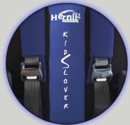
Kvik-lås til 5-punkt sele