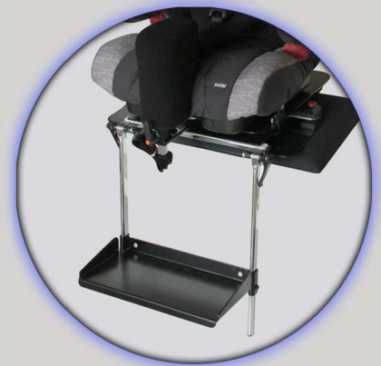
Fodplade, indstillelig i højde og i vinkel